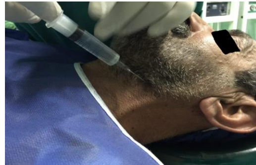
تصویر شماره ۳: بلوک دو طرفه عصب گلو سو فارنژیال با لیدوکائین

Kumar Rath و Pani در سال ۲۰۰۹ یک مورد گزارش دادند که بیمار ۲۷ ساله با فارنژیت و یک توده در حلق و یوولا که با لیدوکائین و دکسمتومدین و میدازولام بی‌درد و سپس با ویدئو لارنگوسکوپ و لوله شماره ۷ بدون هیچ مشکل و کاملاً بیدار انتوبه و سپس بیهوشی کامل گرفت. داروهای به کار رفته در این