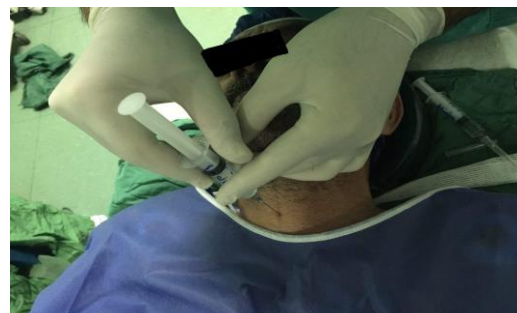
تصویر شماره ۴: بلوک عصب سوپریور لارنژیال (SLN) دو طرفه با لیدوکائین

بعد از آن ۲ سی سی از لیدوکائین ۲ درصد برای بلوک عصب سوپریور لارنژیال (SLN) دو طرفه در قسمت لترال گردن کنار شاخ بزرگ استخوان هیوئید تزریق شد (تصویر شماره ۴). در انتها ۲ سی سی از لیدوکائین ۲ درصد برای بلوک داخل تراشه در مامبران کریکوتیروئید با سرنگ ۵ سی سی به سمت کودال تزریق شد (تصویر شماره ۵) که بلافاصله بیمار دچار سرفه شد و جهت اطمینان از نداشتن رفلکس گاگ، سه پاف از لیدوکائین ۱۰ درصد در ناحیه حلق اسپری شد. پس از حدود ۱۵ دقیقه مانیترینگ از طریق ویدئولارنگوسکوپ (گلاپدسکوپ) بیمار به صورت بیدار و تنفس خودبخودی با لوله شماره ۶/۵ انتوبه شد و پس از اطمینان از قرار داشتن لوله در تراشه، بیهوشی کامل با پروپوفول ۱۵۰ میلی گرم، مورفین ۷ میلی گرم و آتراکوریوم ۳۵ میلی گرم برای بیهوشی کامل تجویز شد.