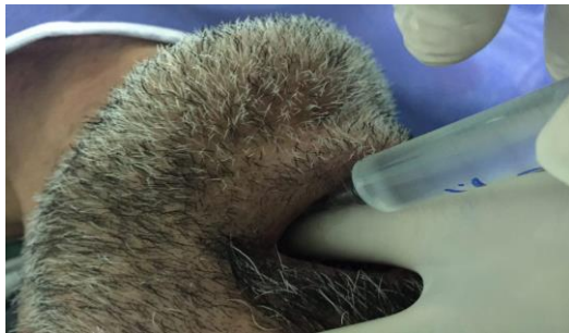
تصویر شماره ۵: تزریق لیدوکائین ۲ درصد برای بلوک داخل تراشه در مامبران کریکوتیروئید به سمت کودال

رزکسیون توده و اطمینان از عدم خونریزی پس از ۴۵ دقیقه طول عمل، بیمار بیدار و اکستوبه شد و با داشتن رفلکس بلع به ریکاوری منتقل گردید. پس از سی دقیقه حضور در ریکاوری، بیمار به بخش مراقبت ویژه منتقل شد که به مدت یک شب در این بخش بستری و سپس به با حال عمومی خوب به بخش گوش حلق و بینی منتقل شد. جواب پاتولوژی بیمار، بافت گرانولوماتوز گزارش شد.