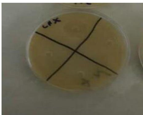
تصویر شماره ۲: وجود هاله عدم رشد میکروبی در محیط کشت باکتری اکتینومیسس نیوزلندی در مجاورت کلرگزیدین ۰/۲ درصد

اما در مورد کلرگزیدین این قطر به ترتیب ۱/۸، ۲، ۱/۹، ۱/۹ میلی متر برای کانیدیدآلیکانس و ۲، ۲، ۱/۹ میلی متر برای اکتینومیسس نیوزلندی و ۱، ۱/۹، ۱/۸، ۱ میلی متر برای استافیلوکوک اورئوس در آزمایش اصلی و سه بار تکرار بعدی آزمایش اندازه گیری شد (تصویر شماره ۲). بنابراین می توان نتیجه گرفت فنی توئین موضعی بر میکروارگانسیم های استافیلوکوک اورئوس، اکتینومیسس نیوزلندی و کانیدیدآلیکانس اثر ضد میکروبی یا ضد قارچی نشان نداد.