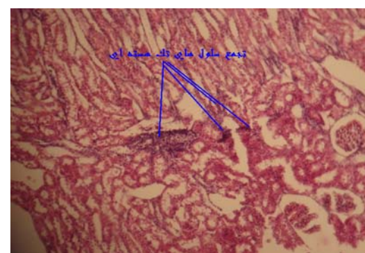
تصویر شماره ۲: تجمع سلول های لنفوسیتی در کلیه، در گروه سیاهدانه-جنتامایسین - باکتری. رنگ آمیزی هماتوکسیلین اتوزین (۱۵۰×)