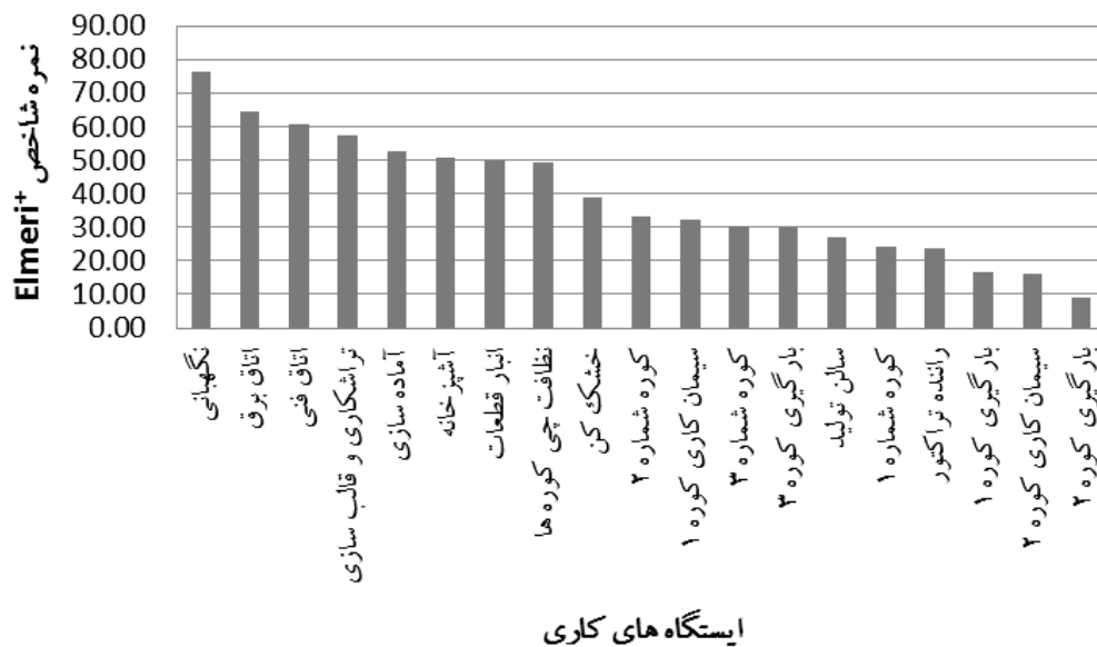
نمودار شماره 1: نمره کل شاخص Elmeri + در ایستگاه‌های مختلف کاری کارخانه تولید سفال

کارگاه‌های مورد بررسی نشان داده است (نمودار شماره 2). از میان 19 ایستگاه مورد بررسی، 12 ایستگاه از نظر معیار بهداشت صنعتی با استاندارد ایمنی مطابقت نداشتند. وضعیت ارگونومی هم در این شرکت با میانگین نمره 29/81 درصد بعد از بهداشت صنعتی، کم‌ترین انطباق را با وضعیت استاندارد نشان داد. ایستگاه‌های کاری کوره‌ها، بارگیری کوره، نظافتچی کوره و راننده تراکتور کم‌ترین نمره را از دیدگاه معیار ارگونومی نشان دادند. از نظر بُعد وضعیت ایمنی مسیرهای عبور و مرور آشپزخانه و بارگیری کوره 3 کم‌ترین نمره را کسب نموده‌اند. از نظر بُعد ایمنی ماشین‌آلات و تجهیزات اتاق برق، خشک کن و نگهداری بالاترین نمره و ایستگاه بارگیری کوره 3، انبار قطعات و همچنین رانندگی تراکتور کم‌ترین نمره را به خود اختصاص داده‌اند. از نقطه نظر معیار نظافت و نظم و ترتیب، ایستگاه کوره شماره 1 و بارگیری کوره در پایین‌ترین سطح بین ایستگاه‌های مختلف قرار داشتند (جدول شماره 2).