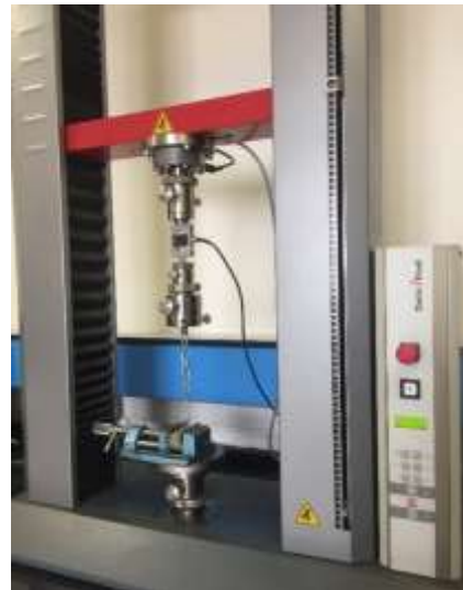
تصویر شماره ۴: نمونه ای که به دستگاه Universal Testing Machine متصل شده است

در حالت کلی عوامل مختلفی در میزان ریتشن رستوریشن های سمان شونده نقش دارند که تحت سه زیر مجموعه از عوامل مرتبط با اباتمنت، عوامل مرتبط با پروتز و عوامل مرتبط با سمان طبقه بندی می شود (۱۲). با توجه به روش های بازیابی (retrievability)، طراحی ترکیبی در پروتزهای پیچ شونده منجر به ایجاد پروتزهای سمان شونده گردید (۱۳). استفاده از این تکنیک، راحتی و زیبایی و در واقع همه مزایای یک پروتز متکی بر ایمپلنت سمان شونده را توأم با مشخصه ارزنده پروتز متکی بر ایمپلنت پیچ شونده، دارا می باشد که همین امر فرآیند بازیابی را تسهیل می کند. این روش مزایای متعددی دارد و به این دلیل که نیاز به ساخت مجدد اجزای از دست رفته و یا آسیب دیده را در صورت بروز مشکل برطرف می نماید، به لحاظ اقتصادی نیز به صرفه تر است.