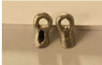
تصویر شماره ۳: نمونه های ساخته شده. فاقد حفره دسترسی (راست) - دارای حفره دسترسی (چپ)

گرفت. هم چنین از آزمون کولموگروف-اسمیرنوف برای سنجش نرمال بودن توزیع داده ها و از آزمون تی، جهت مقایسه دو گروه نیز استفاده شد.