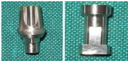
تصویر شماره ۱: اباتمنت (سمت چپ) و آنالوگ (سمت راست) سیستم Noble Biocare

در این مطالعه آزمایشگاهی یک اباتمنت ۶ میلی متری زاویه دار (Angulated) با زاویه ۱۵ درجه سیستم Branemark system, Noble biocare (ساخت سوئیس) به قطر ۴/۳ میلی متر همراه پیچ مربوط و آنالوگ آن تهیه شد (تصویر شماره ۱). سپس آنالوگ در یک بلوک رزینی تهیه شده با آکریل شفاف اتوپلمریزه مخصوص ساخت تری، با زاویه ۱۵ درجه و با استفاده از milling machine قرار داده شد، به گونه ای که اباتمنت ها عمودی قرار بگیرند تا بتوان نیروی کشش را در جهت محور طولی اباتمنت اعمال کرد (تصویر شماره ۲).