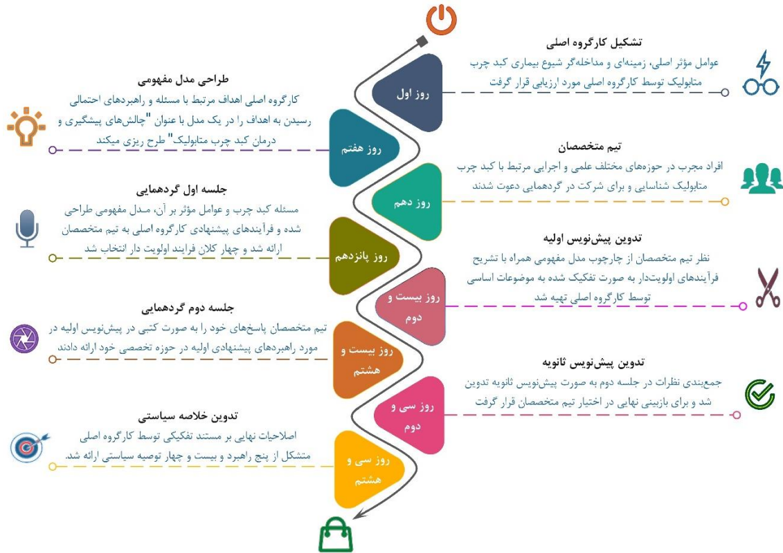
تصویر شماره ۱: فرایند و مراحل تدوین خلاصه سیاستی مدیریت درمان بیماری کبد چرب غیرالکلی (NAFLD)

نظام‌مند و فراتحلیل، عوامل مؤثر در شیوع و مدیریت درمان NAFLD مشخص و سپس، مدل مفهومی «چالش‌های پیشگیری و درمان کبد چرب متابولیک» با در نظر گرفتن اهداف کلان نظام سلامت (کارایی، پایداری، عدالت و رضایتمندی) تدوین شد. یک تیم تخصصی از افراد مجرب در حوزه‌های علمی، پژوهشی و اجرایی مختلف مرتبط با بیماری کبد چرب شامل گروه‌های بالینی داخلی، غدد، رادیولوژی، اپیدمیولوژی، تغذیه، پزشکی مولکولی، فناوری اطلاعات سلامت، تحقیقات بالینی و تحقیق در نظام سلامت (HSR) در تدوین نهایی کلان‌فرایندهای اولویت‌دار، راهبردها و توصیه‌های سیاستی مشارکت داشتند.