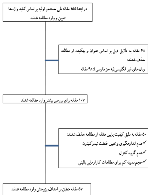
تصویر شماره ۱: نحوه اجرای مطالعه سیستماتیک

مورد بررسی قرار گرفت. پودر سیاه‌دانه به صورت کپسول‌های ۵۰۰ میلی گرمی به ۳ گروه به مقدارهای یک، دو و سه گرمی به مدت ۱۲ هفته داده شد. یافته‌های این مطالعه نشان داد که در گروه‌های دریافت کننده سیاه‌دانه به ویژه مقادیر دریافتی ۲ و ۳ گرم در روز، کاهش معنی داری در قند ناشتای خون، هموگلوبین گلیکوزیله، قند ۲ ساعته پلاسمایی و کاهش مقاومت به انسولین (با استفاده از شاخص مقاومت به انسولین HOMA-IR^1 ) (۲۸) و افزایش معنی داری در عملکرد سلول‌های بتای پانکراس و تولید انسولین مشاهده شد. یکی از ضعف‌های این مطالعه، عدم بررسی گروه دریافت کننده دارونما بود (۲۲). در مطالعه دیگری در سال ۲۰۰۵، اثر تیموکینون بر روی تولید گلوکز کبدی در رت‌های دیابتی مورد بررسی قرار گرفت. این مطالعه نشان داد که در گروه دریافت کننده تیموکینون به مقدار ۵۰ میلی گرم بر کیلوگرم که به مدت ۳۰ روز به صورت گاوآژ داده شد، سبب کاهش معنی داری در گلوکز خون، هموگلوبین گلیکوزیله و گلوکونئوزنز کبدی شد (۲۵). مطالعه