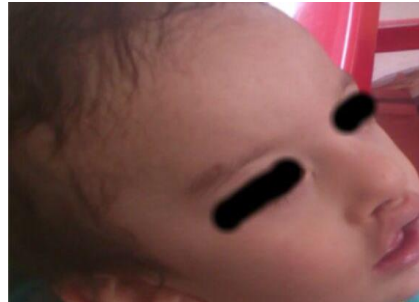
تصویر شماره ۱: شکاف کاذب لب بالایی کودک مبتلا

لازم به ذکر است بیمار تا ۴ سالگی تحت جلسات مداوم گفتاردرمانی (هر هفته ۲ جلسه) و تیم شکاف لب و کام قرار داشت و تا سن ۴ سالگی، بیش‌تر تأخیرهای گفتاری وی جبران شد. در تصاویر شماره ۱ تا ۳ ویژگی‌های ظاهری کودک نشان داده شده است.