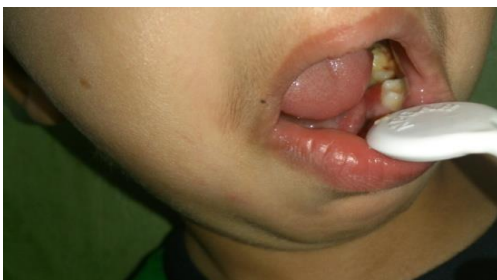
تصویر شماره ۱: تصویر داخل دهانی بیمار از فک بالا و پایین