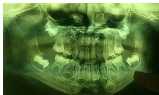
تصویر شماره ۲: رادیوگرافی پانورامیک بیمار، تحلیل شدید استخوان آلوئول

برای بررسی بیش تر، رادیوگرافی پانورامیک، آزمایش کامل خون و ادرار درخواست شد. در بررسی پانورامیک تحلیل شدید استخوان های مندیبل و ماگزایلا و ضایعات متعدد استئولیتیک در ناحیه خلف فکین دیده شد. به دلیل تحلیل استخوان آلوئولار نمای scooped out دیده شد. به علت اروژن و تحلیل استخوان آلوئول دندان ها به صورت floating in air بودند (تصویر شماره ۲).