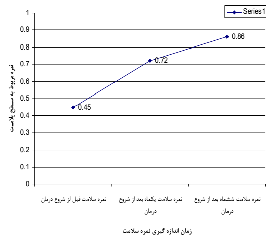
نمودار شماره ۳: نمره سلامت افراد قبل و بعد از درمان با متادون بر مبنای وضعیت سلامت آن‌ها در محورهای پنج گانه

در نهایت نمره سلامتی افراد استخراج شده از روی ابعاد پنج گانه سلامتی در قبل و بعد از درمان با متادون در جدول نمودار شماره ۳ ارائه شده است. همان گونه که در قسمت مواد و روش‌ها توضیح داده شد با استفاده از جدول مربوط به نمره گذاری سطح سلامت EQ-5D وضعیت سلامت افراد بر مبنای پاسخ به پنج سوال مربوطه بین ۰ تا ۱ نمره گذاری و محاسبه شده است.