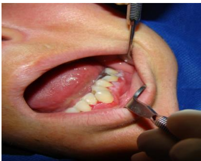
تصویر شماره ۵: بیمار سوم خانم ۳۰ ساله با زخم های دهانی و ژنژویت دسکواماتیو

بیمار چهارم: خانمی ۳۰ ساله بود که او نیز درگیری لته فاسیال در فک پایین به همراه سوزش دهان بدون بیماری زمینه‌ای و مصرف دارویی داشت. در بیوپسی صورت گرفته از ضایعات زخمی دهان او نمای هیستوپاتولوژیک پمفیگوس ولگاریس مشاهده شد، ولی در بررسی ۱۱ ماهه علی‌رغم درمان بیماری پیشرفت کرده و زخم‌ها و تاول‌های وسیعی در تمام بدن بیمار مشاهده شد (تصویر شماره ۶).