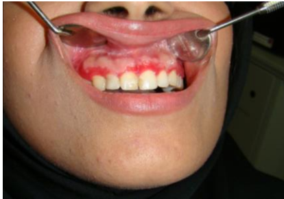
تصویر شماره ۳: بیمار دوم خانم ۲۳ ساله با نمای کلینیکی ژنژویت دسکواماتیو