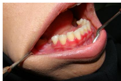
تصویر شماره ۱: بیمار اول خانم ۲۸ ساله با زخم های متعدد دهانی

بیمار سوم: خانم ۳۰ ساله با شکایت از سوزش شدید دهان و زخم‌های فراوان در نقاط مختلف دهان از ۲ ماه و نیم پیش از مراجعه، پس از ترکیدن تاول‌های اولیه به همراه درگیری لته مارژینال به صورت ژنژویت دسکواماتیو به مطب خصوصی مراجعه نمود. بیمار سابقه بیماری و یا مصرف داروی خاصی نداشت. از ضایعات لته‌ای فک پایین بیوپسی تهیه شد و در بررسی هیستوپاتولوژیک پمفیگوس ولگاریس تشخیص داده شد. بعد از پیگیری ۱۲ ماهه ضایعات دهانی کنترل شده بود و زخمی در سایر نقاط بدن دیده نشد (تصویر شماره ۵).