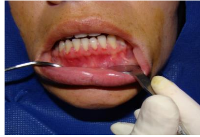
تصویر شماره ۶: بیمار چهارم خانم ۳۰ ساله با زخم‌های فراوان در لته فاسیال و ژنویت دسکواماتیو

در مطالعه Rath و Reenesh زخم‌های لته‌ای به