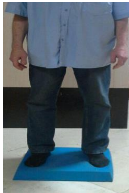
تصویر شماره ۱: تمرین روی تعادل پد

ارزیابی ها یک جلسه پیش از شروع جلسات تمرینی و هم چنین یک جلسه پس از اتمام دوره تمرینی به منظور جلوگیری از عوارض خستگی آزمون بر عملکرد افراد انجام شد. پس از سنجش اولیه به وسیله آزمون های فوق، ده جلسه تمرینی به صورت یک روز در میان که هر کدام بیست تا سی دقیقه زمان می برد، انجام شد. طراحی تمرینات به گونه ای صورت گرفت که شاخص های توانایی در برقراری تعادل ایستا (مدت زمان، تعادل پویا (تعداد تکرار) و تعادل در صفحات مختلف حرکتی را در بر گرفت (۳۲). داده ها پس از جمع آوری توسط نرم افزار آماری SPSS نسخه ۲۲ مورد تجزیه و تحلیل قرار گرفت. در تجزیه و تحلیل داده ها برای اطمینان از طبیعی بودن داده ها از آزمون shapiro walk استفاده شد. برای تعیین اختلاف بین پیش آزمون و پس آزمون هر یک از گروه ها از آزمون های تحلیل یک طرفه واریانس (ANOVA)، من ویتنی و آزمون تعقیبی Tukey استفاده شد.