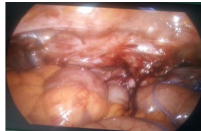
تصویر شماره ۱: کاف واژن قبل و پس از ترمیم