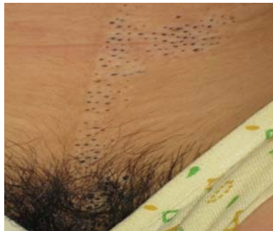
تصویر شماره ۲: ضایعات نووس کومدونیکوس شکم و عانه و قسمت خارجی تناسلی