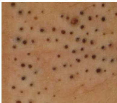
تصویر شماره ۳: ضایعات کومدونووس بیمار از نمای نزدیک