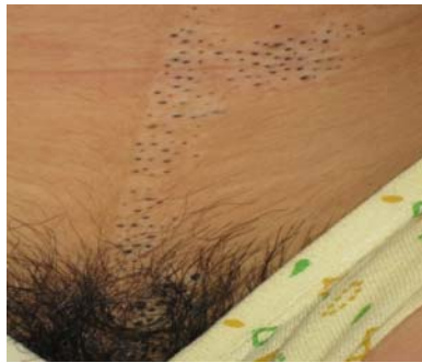
تصویر شماره ۲: ضایعات نووس کومدونیکوس شکم و عانه و قسمت خارجی تناسلی