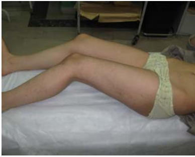
تصویر شماره ۱: ضایعات کومدو نووس یک طرفه با آرایش خطی در بیمار