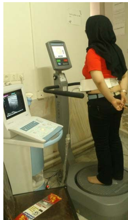
تصویر شماره ۱: وضعیت قرارگیری آزمودنی بر روی دستگاه تعادل بایودکس

جهت تعیین میزان فعالیت عضلات شکمی در آزمون های مختلف، از مقادیر نرمالایز شده و محاسبه درصد تغییر ضخامت عضله استفاده گردید (۳۴). بدین ترتیب که اختلاف ضخامت عضله در وضعیت ایستاده به وضعیت استراحت (در وضعیت خوابیده) نسبت به ضخامت همان عضله در وضعیت استراحت (در وضعیت خوابیده) تقسیم گردیده و ضربدر ۱۰۰ می گردید (۲۱). داده های دستگاه تعادل بایودکس نیز در هر یک از شرایط آزمون پاسچرال در حافظه دستگاه تعادل بایودکس ذخیره و استخراج می گردید. جهت ارزیابی میزان انطباق توزیع متغیرهای کمی با توزیع نظری نرمال از آزمون کولمگروف-اسمیرنوف ۲ (K-S) استفاده گردید. جهت بررسی ارتباط بین شاخص های ثباتی پاسچرال و میزان تغییر ضخامت عضلات شکمی در سطوح اتکاء بی ثبات در افراد مبتلا به کمردرد از آزمون همبستگی