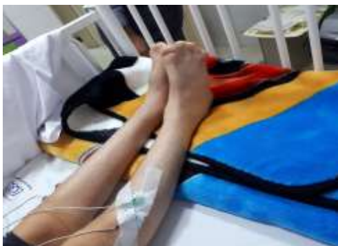
تصویر شماره ۲: چسبندگی پوستی انگشتان پا

استاندارد طلایی تشخیص آپنه انسدادی خواب تست پلی سومنوگرافی است. پلی سومنوگرافی (PSG) پارامترهای متعددی را در حین خواب می‌سنجد، این پارامترها شامل نوار مغزی، حرکات چشمی، چانه و پاها، جریان هوا از بینی و دهان، حرکات تنفسی قفسه سینه و شکم، اکسیژن خون و دی‌اکسید کربن انتهای بازدمی می‌باشد. در این تست مراحل خواب، کیفیت خواب، مقدار و نوع آپنه و هیپوپنه تنفسی، سطح اکسیژن خون و میزان تغییرات آن‌ها در هر ساعت و بسیاری پارامترهای دیگر قابل بررسی می‌باشد (۷).