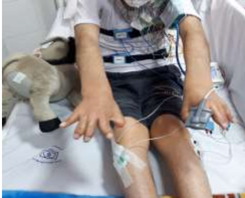
تصویر شماره ۱: چسبندگی پوستی انگشتان دست

در سابقه پزشکی، بیمار به جهت کرائیوسینوستوزیس در ۱۴ ماهگی تحت جراحی باز کردن سوچور کرونال قرار گرفته بود و در دوران نوزادی نیز هیدروسفالی گزارش شده بود (تصویر شماره ۱ و ۲).