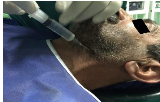
تصویر شماره ۳: بلوک عصب سوپریور لارنژال (SLN) دو طرفه با لیدوکائین

در مقاله فوق که در شماره ۱۶۱ خرداد ۱۳۹۷ در دوره ۲۸ این نشریه منتشر شده بود، اسم آقای دکتر هوشنگ اکبری در چکیده انگلیسی اشتباه چاپ شده بود، اصلاح گردید. و زیرنویس عکس های شماره ۳ و ۴ نیز اشتباه چاپ شده بود که اصلاح گردید.