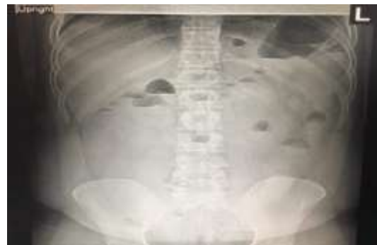
تصویر شماره ۱: درگرافی ساده شکم، چندین سطح مایع هوا دیده می شود