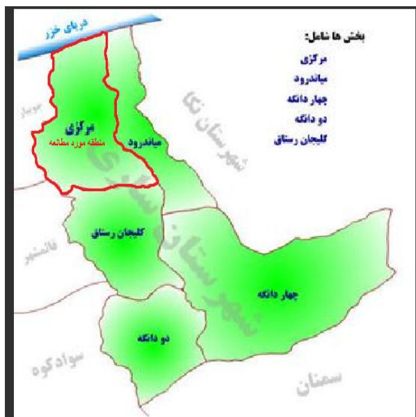
تصویر شماره 1: موقعیت جغرافیایی منطقه مورد مطالعه

به مقررات و اخلاق پژوهش و تحت مجوز با کد IRMAZUMS.REC.1397.2867 انجام گرفت.