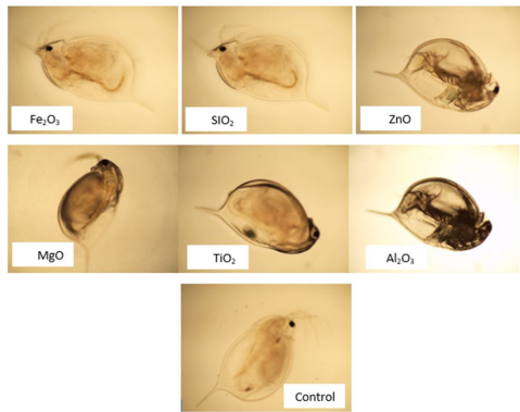
تصویر شماره 1: جذب نانوذرات و تغییرات مورفولوژیکی توسط دافنیا مگنا