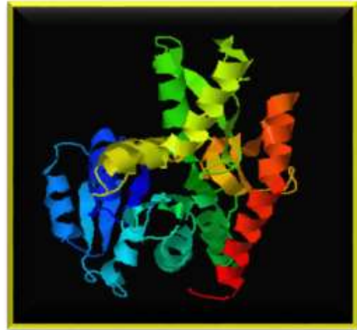
تصویر شماره ۲: مشخصات پروتئین گلیکوزومال ملات دهیدروژناز مدل سازی شده بر اساس روش تشابه (Homology modeling) با استفاده از برنامه برخط I-TASSER (On-line).

○ C-score= 1.19 ○ Estimated TM-score= 0.88±0.07 ○ Estimated RMSD= 3.9±2.6 Å