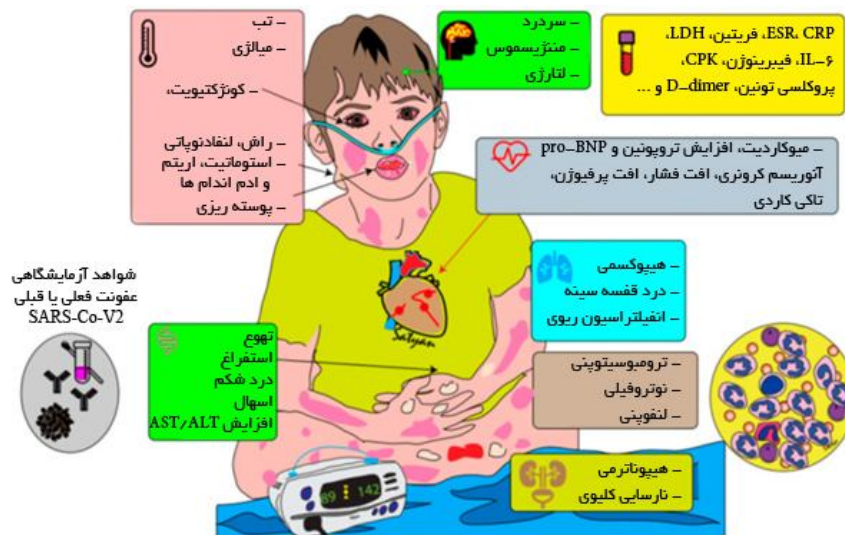
تصویر شماره 1: فیزیوپاتولوژی MIS-C

در این مقاله، نشانه‌ها، عوارض و شیوه برخورد با MIS-C مرتبط با کووید-19 براساس منابع منتشر شده تاکنون و براساس دستورالعمل‌های موجود تنظیم شده است. این موارد ممکن است به مرور و تازمانی که پاندمی تمام زوایای خود را نشان دهد و تجربه و دانش در آن به تکامل برسد تغییر کند. در مورد مراحل پاتوژنز کووید-19 دو زیر گروه مجزا که با هم همپوشانی دارند مطرح شده