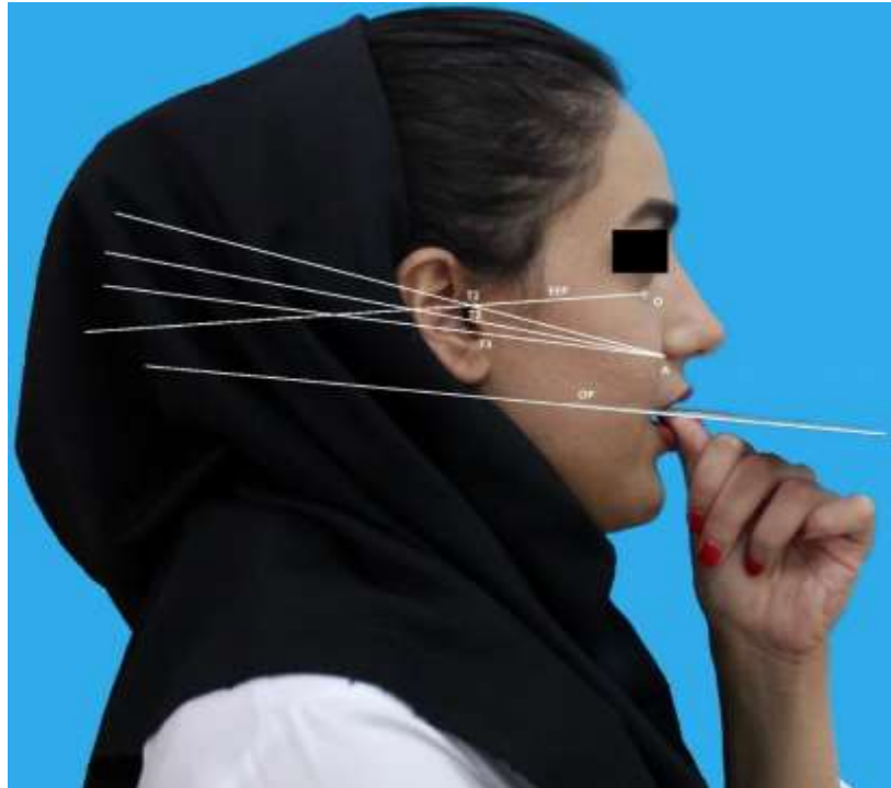
تصویر شماره ۱: خطوط و نقاط ترسیم شده بر روی تصاویر در نرم افزار اتو کد - EEP (eye-ear plane): خطی که از نقطه O (نوار چسب) تا Tragon (T1) کشیده می شود؛ نماینده ای از پلن فرانکفورت می باشد. - خط آلتراگوس (پلن کمپر): از آلائی بینی (A) تا سه نقطه مشخص شده روی تراگوس گوش (T1، T2، و T3)، رسم می شود و به ترتیب ۳ خط حاصل می شود: AT1، AT2، و AT3. - OP (occlusal plane): خطی که در امتداد fox-plane کشیده می شود.