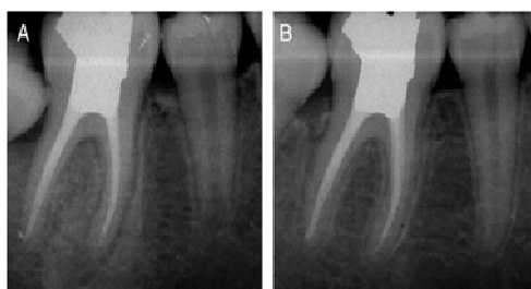
تصویر شماره 1: استئیت کندانسه؛ (A) افزایش بافت استخوانی منتشر در نتیجه استئیت کندانسه (B) نتیجه معمول پس از درمان کانال ریشه یا استخراج که استخوان اطراف به حالت عادی درآمده است

به یک محرک التهابی پالپی با شدت پایین و مدت طولانی معرفی شده است. استئیت کندانسه معمولاً در آپکس دندان‌ها مشاهده شده و پاتوژن‌های قدیمی پالپ در آن یافت می‌شود (4-2). بررسی‌های هیستولوژیک، جایگزینی مغز استخوان اسفنجی با استخوان متراکم را در این ضایعه نشان داده است. هم‌چنین در برخی موارد فیروز و فاکتورهای التهابی نیز مشاهده می‌شود (7-5). ویژگی‌های رادیوگرافی استئیت کندانسه عبارت‌اند از ضخیم‌شدگی فضای لیگامان پرئودنتال و مرزهای پراکنده رادیوپیک که عموماً در اطراف آپکس ریشه قرار دارند و ممکن است ضایعه التهابی رادیولوسنت داشته باشند (1,3,8). استئیت کندانسه عموماً در خلف مندیبل (عمدتاً مولر اول) و بیش‌تر در زنان دیده می‌شود. این یافته ممکن است در نواحی بی‌دندان یا همراه با دندان‌های دارای پالپ التهابی یا نکروتیک و یا دندان‌های درمان ریشه شده رخ دهد (12-9). استئیت کندانسه ممکن است تغییرات مداوم در ساختار استخوانی را نشان دهد که پس از درمان مناسب، اغلب به‌طور جزئی یا کامل از بین می‌روند و در رادیوگرافی، لیگامان پرئودنتال و استخوان اطراف آن به‌صورت نرمال دیده می‌شوند (تصویر شماره 1) (4,13).