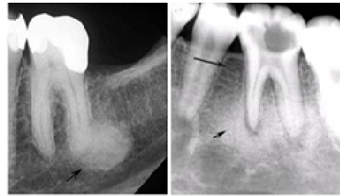
تصویر شماره 2: بوردهای نامشخص (راست) و مشخص (چپ)

عمیق بودند، بررسی شدند. این ضایعات به‌عنوان استئیت‌کنندانه در نظر گرفته شده که در ارتباط با التهاب مزمن بودند. انواع بوردهای رادیولوژیک شامل بوردهای ill-defined و well-defined می‌باشد. بوردر ill-defined بوردری است که حدودش نامشخص است و با مداد دور تا دور ضایعه را نمی‌توان مشخص کرد. Blending border از انواع بوردهای نامشخص است و به بوردری گفته می‌شود که شامل تبدیل تدریجی بین استخوان تراپیکولار با نمای طبیعی و تراپیکول‌های غیرطبیعی ضایعه می‌باشند. بوردر well-defined بوردری است که دارای حدود خارجی واضح و مشخص است و با مداد دور تا دور ضایعه را می‌توان مشخص کرد (14،6). بوردها در کلیشه رادیوگرافی بیماران مراجعه کننده برای این ضایعات رادیوآپیک تعیین شدند (تصویر شماره 2). شکل ضایعه نیز به صورت بیضی، گرد و نامنظم مشخص شد (تصویر شماره 3).