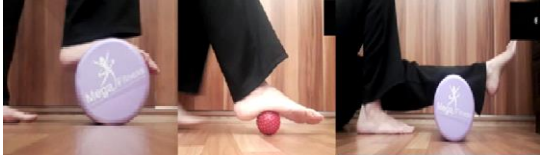
تصویر شماره ۱: تمرینات خودرهاسازی به ترتیب از سمت راست به چپ، تمرین شماره ۱، ۲ و ۳

۳. قرار دادن فوم رولر در زیر ساق پا در حالت نشسته و حرکت آرام پا روی فوم رولر بود. تمام حرکات خود رهاسازی در ۳ ست با ۲۰ تکرار برای هر پا انجام شد (تصویر شماره ۱).