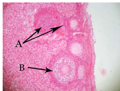
شکل شماره ۳: منظره ریزینی از تخمدان خرگوش سفید نیوزلندی تیمار شده با سیکلوفسفامید و هورمون رشد. حضور فولیکول های آترتیک (A) به همراه فولیکول های سالم (B) در این تصویر مشخص می باشد (هماتوکسیلین - اتوزین، درشت نمایی \times 100 )