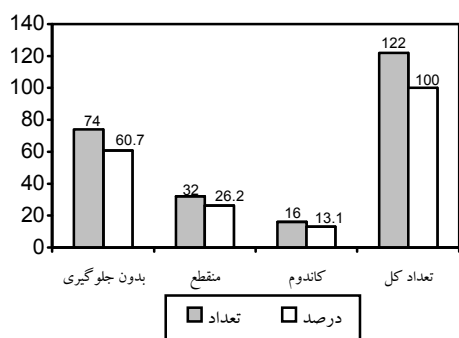
نمودار شماره ۳: روش های جلوگیری از حاملگی بعد از ترک مصرف قرص در حاملگی های بدون برنامه.

از ۱۲۲ مورد (۶۵درصد) حاملگی بدون برنامه که قبل از بروز حاملگی مصرف قرص را ترک کرده بودند، هیچ یک فوراً استفاده از روش های جلوگیری دیگر را آغاز ننموده، به طوری که ۷۴ نفر (۶۰/۷درصد) از افراد فوق، بعد از ترک مصرف قرص، از هیچ روش جلوگیری از بارداری دیگر تا بروز حاملگی استفاده نکرده بودند؛ ۳۲ نفر (۲۶/۲درصد) استفاده از روش منقطع، و ۱۶ نفر (۱۳/۱درصد) استفاده از کاندوم را به دنبال یک تأخیر زمانی شروع نموده بودند (نمودار شماره ۳).