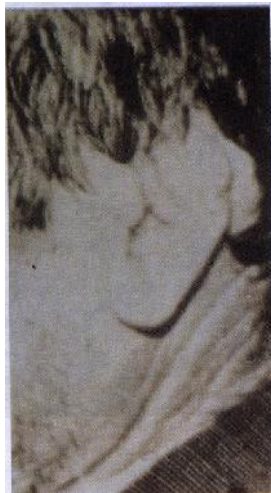
تصویر شماره ۱: تغییر شکل لاله گوش بر اثر رسوب پیگمانتاسیون اکرونوتیک.

در معاینه فیزیکی تغییر شکل و رنگ لاله گوش چپ بدون درد مشهود بود (تصویر شماره ۱).