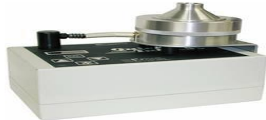
تصویر شماره ۱: دستگاه نمونه بردار Quick Take 30

داخل دستگاه قرار گرفت. دبی جریان نمونه‌برداری ۲۸/۳ L/min و مدت زمان نمونه‌برداری پنج دقیقه برای نمونه‌برداری هوای واحدهای مختلف هر دانشکده در نظر گرفته شد.