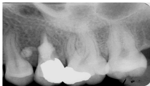
تصویر شماره ۶: دو سال پس از درمان