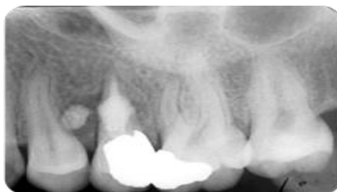
تصویر شماره ۵: شش ماه پس از درمان