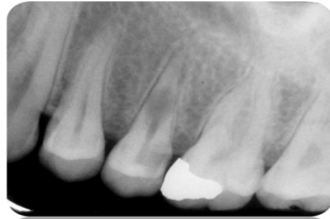
تصویر شماره ۱: رادیوگرافی تشخیصی

کانال شد که با خونریزی شدید کانال همراه بود که با توجه به تشخیص تحلیل، قابل انتظار بود. رادیوگرافی تعیین طول تهیه شد (تصویر شماره ۲).