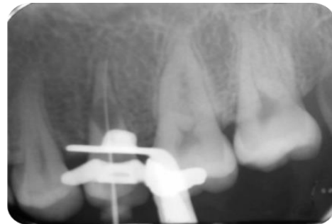
تصویر شماره ۲: رادیوگرافی تعیین طول

برای شستشوی هیپوکلریت ۵/۲۵ درصد و نرمال سالین (داروپخش، تهران، ایران) به طور متناوب استفاده شد. آماده‌سازی کانال با استفاده از فایل دستی استنلس استیل به طریقه step back تا شماره ISO ۶۰ انجام شد و در انتها گیتز گیلدن (Dentsply Maillefer, Ballaigues, Switzerland) شماره‌های ۲ و ۳ استفاده شد. مرتباً از شستشودهنده استفاده شد. اما خونریزی شدید به هیچ عنوان قابل کنترل نبود. جهت کنترل خونریزی پودر کلسیم هیدروکساید (گلچای، تهران، ایران) به داخل کانال گذاشته شد که توسط خونریزی کانال شسته شد. به ناچار مجدداً کلسیم هیدروکساید به صورت پودر داخل کانال فشرده شد و حفره دسترسی توسط cavisol (گلچای، تهران، ایران) مسدود شد. به بیمار توصیه شد که ده روز بعد جهت