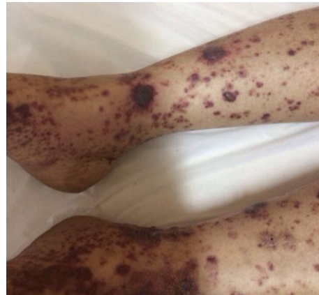
تصویر شماره ۱: هنگام مراجعه

ضعف، درد شکم، الیگوری و ضایعات پوستی پتشی و پورپورا و ادم اندام تحتانی از سه روز قبل به بیمارستان رازی قائمشهر در سال ۱۳۹۲، مراجعه کرده است. درد شکم بیمار به صورت گهگاهی، بدون ارتباط با غذا خوردن و با ارجحیت اطراف ناف بوده است. ضایعات پوستی بیمار نیز به طور حاد به صورت ضایعات پتشیال، پورپورال و بعضاً اکیموتیک و با شروع از اندام تحتانی تظاهر نموده که به تدریج تا حوالی ناف را درگیر کرده بود (تصویر شماره ۱). بیمار تا دو هفته قبل از بروز علائم در وضعیت خوب بالینی قرار داشته است.