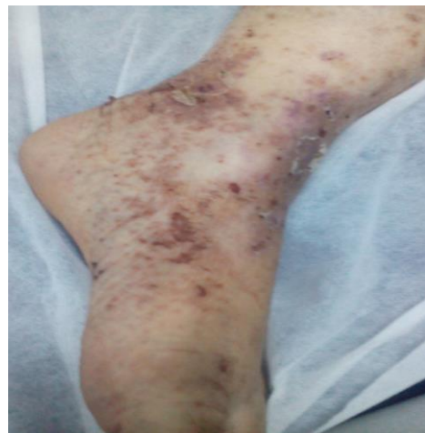
تصویر شماره ۲: پس از درمان

بیمار سابقه‌ای از کاهش وزن، تب، هماتمز، ملنا، ایستاکسی، تنگی نفس، آرتراژی یا مشکلات دیگر را