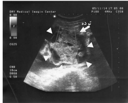
تصویر شماره ۲: تصویر توده گردنی جنین که در سونوگرافی داپلر در برش آگزیکال به صورت نواحی کم عروق دیده می شود

گردن با امتداد به فک تحتانی جنین و اثر فشاری روی شراین کاروتید و وریدهای ژوگولر مشاهده شد (تصویر شماره ۱). در بررسی با داپلر رنگی توده کم عروق دیده شد (تصویر شماره ۲). در سایر ارگان های جنین ناهنجاری قابل رویت نبود.