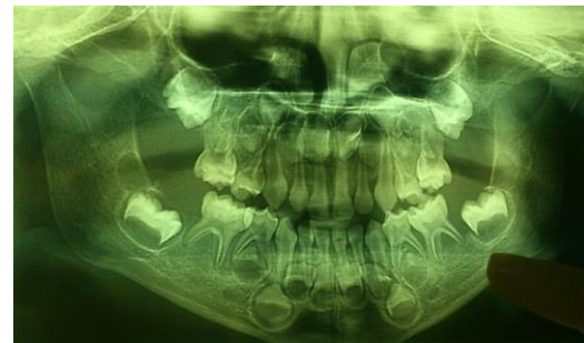
تصویر شماره ۲: رادیوگرافی پانورامیک بیمار، تحلیل شدید استخوان آلوئول

برای بررسی بیش تر، رادیوگرافی پانورامیک، آزمایش کامل خون و ادرار درخواست شد. در بررسی پانورامیک تحلیل شدید استخوان های مندیبل و ماگزایلا و ضایعات متعدد استئولیتیک در ناحیه خلف فکین دیده شد. به دلیل تحلیل استخوان آلوئولار نمای scooped out دیده شد. به علت اروژن و تحلیل استخوان آلوئول دندان ها به صورت floating in air بودند (تصویر شماره ۲).