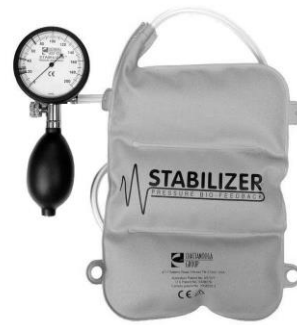
تصویر شماره ۲: دستگاه بیوفیدبک فشاری

هیپ در این نقطه توسط گونیامتر بر حسب درجه اندازه گیری می‌شد. چارت امتیازدهی قدرت در این آزمون در جدول شماره ۱ نشان داده شده است (۱۹). پیش از اجرای سه آزمون اصلی، فرد می‌توانست دو مرتبه نحوه اجرای آزمون را تمرین نماید. بهترین نمره از بین سه تلاش فرد در اجرای آزمون به عنوان نمره آزمودنی ثبت می‌شد. پیش از اجرای آزمون، توضیحات شفاهی و بصری برای کلیه آزمودنی‌ها توسط آزمونگر داده شد.