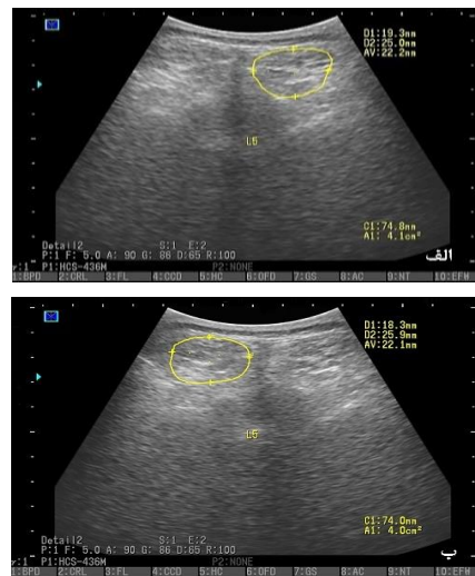
تصویر شماره ۳: تصویر سونوگرافی عضله مولتی فیدوس در سطح L5 (الف: سمت راست؛ ب: سمت چپ)

نیز فاشیای سطحی عضله لبه فوقانی و فاشیای جدا کننده عضله لانجیسیموس با مولتی فیدوس تعریف شدند (تصویر شماره ۳). روایی و پایایی این روش در مطالعات قبلی مورد بررسی قرار گرفته است که از سطح قابل قبولی برخوردار است (۲۶،۲۵). اندازه گیری متغیرهای مورد نظر توسط یک ارزیاب ماهر انجام گرفت که نسبت به گروه بندی آزمودنی ها اطلاعی نداشت.