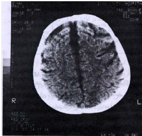
تصویر ۱: ارتشاح ساب دورال بدون اثر فشاری آتروفی مغز و وتریکولومگالی