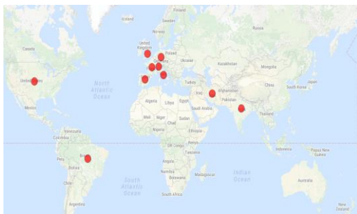
تصویر شماره ۲: پراکندگی ۱۰ کشور پیشتاز در پژوهش های واکسن لیثمانیا

همین طور که در تصویر شماره ۲ مشخص است، از نظر توزیع جغرافیایی، کشورهای اروپایی با داشتن چهار نماینده در بین ده کشور فعال جهان، فعالیت بیشتری