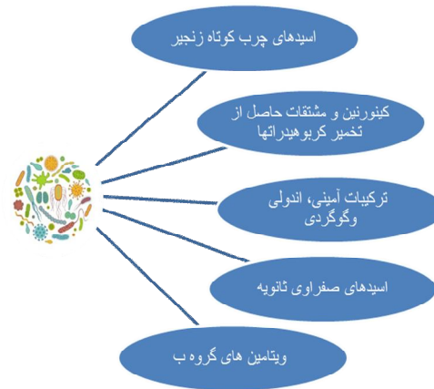
تصویر شماره 2: متابولیت های مترشحه از میکروبیوتای روده

هستامین، دوپامین، p-cerosole، فنیل استیل گلوتامین و فنیل استیل گلايسين نیز می‌شود (67). تخمیر پروتئین‌ها منجر به تولید ترکیبات بالقوه سمی مانند ترکیبات آمینی و اندولی می‌شود که برای بدن مضر هستند و عوارض متعددی برای فرد به همراه دارند. این ترکیبات قادر به اتصال به گیرنده هیدروکربن آریل هستند که ترکیب مهمی در رونویسی است و در تنظیم غدد درون‌ریز، سیگنالینگ سیتوکین‌ها، گسترش سرطان و پیشرفت بیماری‌های اعصاب و روان نقش دارد. ترکیبات اندولی می‌توانند شرایط پیش التهابی ایجاد کنند و باعث ایجاد و پیشرفت بیماری‌های متابولیک شوند. نسبت باکتری‌های ساکارولیتیک و پروتئولیتیک عامل مهمی در سلامتی افراد است. افزایش نسبت باکتری‌های پروتئولیتیک با افزایش تولید ترکیبات اندولی، آمینی و گوگردی، منجر به بروز عوارض متعدد (افزایش التهاب، تغییر تنظیمات سیستم غدد درون‌ریز، پیشرفت بیماری‌های التهابی، متابولیسم و عصبی) می‌شود در حالی که افزایش نسبت باکتری‌های ساکارولیتیک با افزایش تولید محصولات حاصل از تخمیر فیبرها مانند اسیدهای چرب کوتاه زنجیر باعث کاهش التهاب و بهبود عملکرد دستگاه گوارش و غدد و همچنین ارتقا سلامتی افراد می‌شود (68).