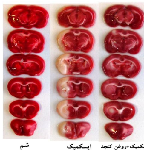
تصویر شماره ۱: برش‌های مغزی رنگ آمیزی شده با محلول TTC در گروه‌های مورد مطالعه، کاهش حجم ضایعه در نمونه تهیه شده از حیوان درمان شده با روغن کنجد مشهود است

انسداد شریان میانی مغز به مدت ۶۰ دقیقه در نیمکره چپ مغز حیوانات گروه ایسکمیک، آسیب قابل