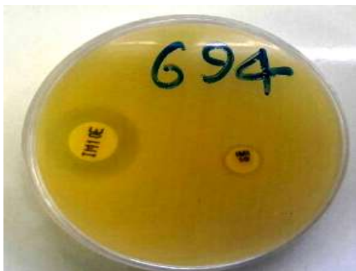
تصویر شماره ۱: شناسایی فنوتیپی سویه‌های تولید کننده متالوبتالاکتاماز روش CDT

آسیتوباکتر بومانی مقاوم به چند دارو داشت. بیشترین نمونه‌های مقاوم به کارباینم‌ها مربوط به بیمارستان زارع بودند، در حالی که ۱۰۰ درصد سویه‌های جدا شده از زخم‌های سوختگی نسبت به کارباینم‌ها مقاوم بودند. در این مطالعه ۹۷ درصد از ایزوله‌های بالینی آسیتوباکتر بومانی که حداقل به سه کلاس آنتی بیوتیکی مقاوم بودند (MDR) multi-drug resistant و همه این ایزوله‌ها علاوه بر سه کلاس آنتی بیوتیکی به خانواده کارباینم‌ها هم مقاوم بودند که به عنوان سویه‌های extensively drug resistant (XDR) شناسایی شدند. هم‌چنین از ۹۷ ایزوله آسیتوباکتر بومانی غیر حساس به کارباینم‌ها و بر اساس روش فنوتیپی CDT با استفاده از دیسک ترکیبی، ۹۵ (۹۷/۹ درصد) ایزوله به عنوان سویه‌ی تولید کننده‌ی آنزیم‌های متالوبتالاکتاماز مورد شناسایی قرار گرفتند (تصویر شماره ۱).