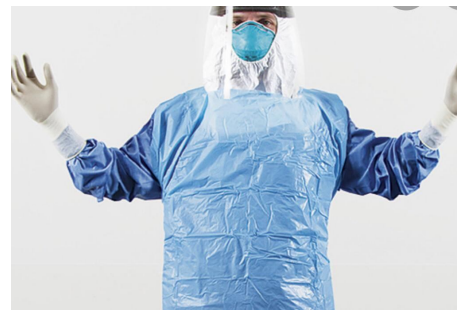
تصویر شماره 3: وسایل حفاظت شخصی (PPE)

کنند. در حفاظت از ناحیه سر و صورت باید دقت خاصی داشت و استفاده از کلاه های یک بار مصرف، عینک، شیلد محافظ صورت، ماسک های فیلتر دار یک بار مصرف (FFP 1-3 و N95) و دستکش های محافظ یک بار مصرف ضروری است (تصویر شماره 3). پژوهش ها وجود احتمال ابتلای کادر درمان به علت دفع نادرست وسایل حفاظت شخصی را نشان داده اند (33).