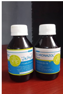
تصویر شماره 1: نمونه شربت کرونازول