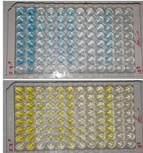
تصویر شماره 1: بلیت طراحی چکرپورد برای آنتی ژن F2؛ بعد از اضافه کردن TMB (a) و بعد از اضافه کردن Stop (b)

جدول شماره 3: میزان Signal به Noise داده‌ها