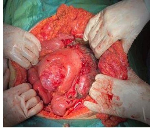
تصویر شماره 1: توده‌ی حفره‌ی شکم که روده‌ی باریک را درگیر کرده است (عکس پس از انجام لاپاراتومی میدلاین و ورود به پریتونن گرفته شده).