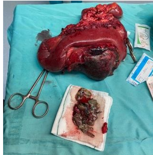
تصویر شماره 2: توده‌ی شکمی همراه قسمت درگیر روده‌ی باریک تحت رزکسیون قرار گرفت.