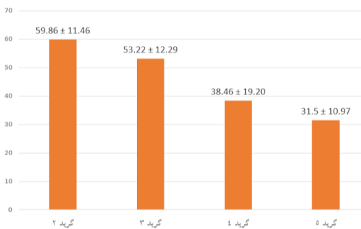
نمودار شماره ۱: میانگین درصد بیان CD38 برحسب درجه‌ی گلیسون اولیه ( P < 0.001 )

نمودارهای یک تا سه متوسط درصد بیان CD38 را به ترتیب برحسب درجه گلیسون اولیه، ثانویه و مجموع نشان می‌دهد.