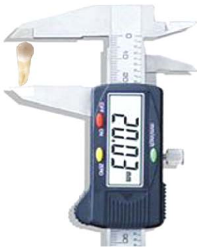
تصویر شماره ۱: اندازه گیری طول دندان کشیده شده

سپس اندازه گیری طول دندانی روی کلیشه های پانورامیک و دندان های خارج شده به صورت حداکثر فاصله عمودی بین اپکس ریشه تا نوک کاسپ باکال انجام گرفت.