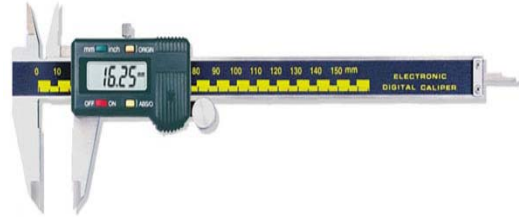
تصویر شماره ۳: کولیس دیجیتال (با دقت ۰/۰۱ میلی متر)

ثبت شد. در صورت اختلاف در اندازه گیری ها میانگین آن ها ثبت گردید. برای تمامی بیماران فرم هایی تنظیم شد که در آن ها مشخصات فردی بیمار ذکر گردید. تمامی اندازه های طول واقعی و رادیوگرافیک دندان ها در فرم مربوط به ثبت رسیده و مورد مقایسه قرار گرفتند.