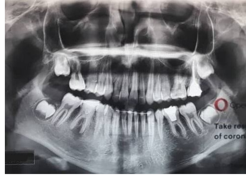
تصویر شماره 4: نمای رادیوگرافی پانورامیک بعد از پایان درمان