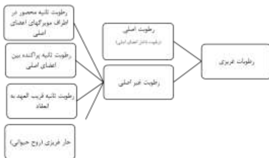
تصویر شماره ۲: انواع رطوبات غریزی

در پایان می‌توان نتیجه گرفت که با توجه به داده‌های به‌دست آمده از متون قدیم می‌توان رطوبت غریزی را به دو قسم رطوبت غریزی اصلی و غیراصلی تقسیم کرد (تصویر شماره ۲). رطوبت غریزی اصلی: رطوبت موجود در اعضای مفرده اصلی (منوی) است. این رطوبات از زمان جنینی پس از طی مراحل آماده‌سازی سه‌گانه در سیستم‌های گوارشی، تناسلی و رحمی در اعضای بدن قرار گرفته و باعث پیوستگی اجزای عضو می‌گردد، منشأ اصلی این رطوبت، نطفه است.