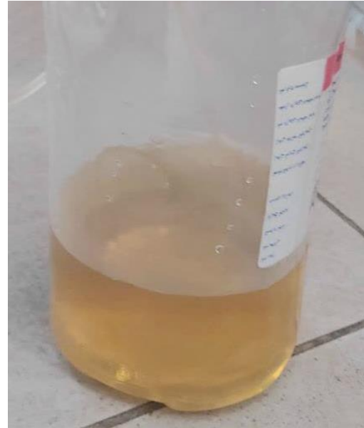
تصویر شماره ۲: مایع پلورال بیمار بعد از توراستنژ تشخیصی