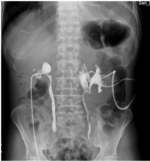
تصویر شماره ۴: نفروستوگرافی دوطرفه

سرویس رادیولوژی، برای بیمار نفروستومی دوطرفه تعبیه گردید که پس از آن، حدود ۱۴ لیتر ادرار خارج شد. سی تی اسکن ریه مجدد برای بیمار انجام شد که افیوژن پلورال کاهش قابل توجهی داشت. مایع آسیت نیز برطرف شد (تصویر شماره ۳).