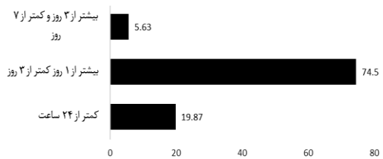
نمودار شماره ۲: شروع عوارض جانبی پس از سومین دوز واکسن آسترانکا (تعداد=۲۴۳)

همسو می‌باشد. در اکثر مطالعات انجام گرفته مانند Andrzejczak-Grzadko و Kamal, Al Bahrani, Menni بیشترین عارضه گزارش شده، درد در محل تزریق بوده است (۱۰، ۱۷-۱۵). که نتایج آن‌ها با مطالعه حاضر همخوانی دارد. پژوهش دیگری به بررسی شیوع عوارض جانبی واکسن آسترانکا در کارکنان بهداشتی پرداخت. در مطالعه مذکور ۲۵۴ نفر از کارکنان بهداشتی که دوز اول و دوم واکسن آسترانکا را دریافت کرده بودند پرسشنامه خوداظهاری عوارض واکسن را به صورت آنلاین تکمیل نمودند. نتایج حاکی از آن بود که شیوع حداقل یک عارضه جانبی بعد از دوز اول واکسن ۹۱ درصد و بعد از دوز دوم واکسن ۶۷ درصد بوده است هم‌چنین درد در محل تزریق به‌عنوان شایع‌ترین عوارض جانبی بعد از دوز اول و دوم واکسن و سپس سردرد، تب و درد عضلانی گزارش شد (۱۸). علاوه بر این Darraj و همکاران گزارش کردند که قرمزی و درد در محل تزریق از بالاترین میزان فراوانی در بین عوارض جانبی برخوردار بود (۱۹) که با نتایج مطالعه حاضر مرتبط می‌باشد. در بررسی رابطه بین شایع‌ترین عوارض جانبی و واکسن آسترانکا، نتایج پژوهش Emary و همکاران (۲۰۲۱) در انگلستان نشان داد سرفه، تب و تنگی نفس از شایع‌ترین عوارض بعد از تزریق واکسن آسترانکا