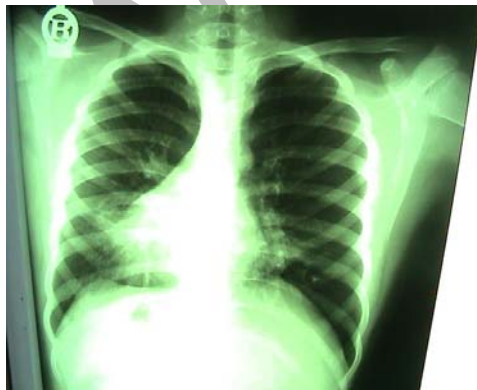
شکل شماره ۳: تصویر دکستروکاردی و ارتشاح ریه در تصویر گرافی مورد دوم