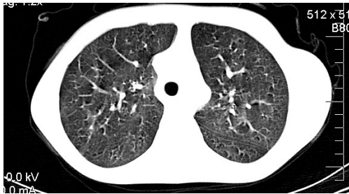
شکل شماره ۱: درجانی از برونشکتازی در دو طرف ریه در HRCT ریه مورد اول

کرده بود. در گرافی قفسه سینه دکستروکاردی و در سونوگرافی شکم جابجایی کبد و طحال و دارای سینوس اینورسوس کامل بود. در نهایت با بیوپسی از مخاط بینی و میکروسکوپ الکترونی عدم بازوی دنین در مژک‌ها مشخص و تشخیص قطعی سندرم کارتاجنر داده شد (جدول شماره ۱).