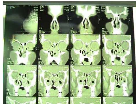
شکل شماره ۴: تصویر پان سینوزیت در سی تی اسکن سینوس های مورد دوم

مژک‌ها در دفاع فیزیکی سیستم تنفسی نقش مهمی دارند و اختلال آنها سبب عفونت‌های مکرر و مزمن تنفسی می‌شود که پنومونی و سینوزیت از جمله آنها هستند و بدنبال آن برونشکتازی در آنها بسیار شایع می‌باشد (۹، ۸) که